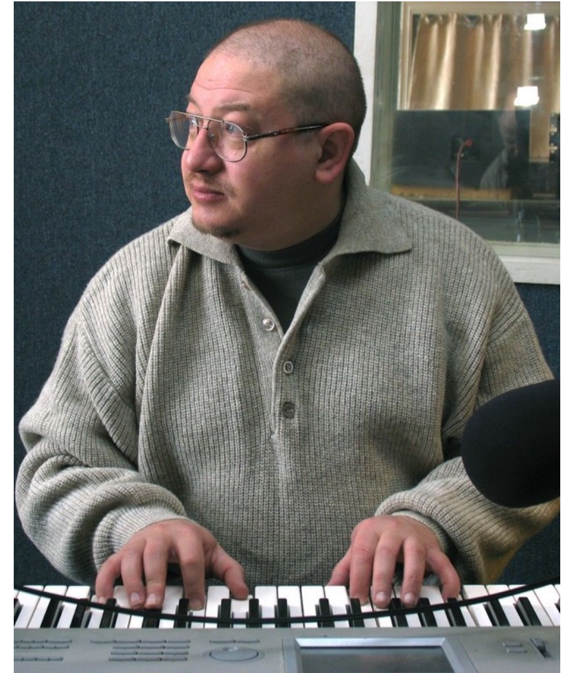
Александр Пантыкин «Дедушка уральского рока»