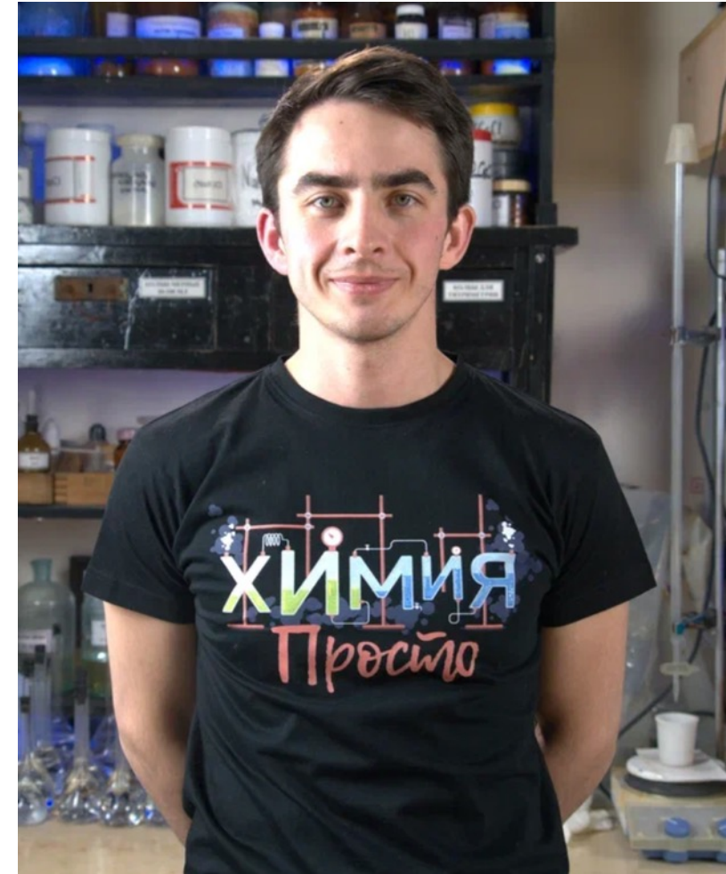
Александр Иванов Автор «Химия — Просто»